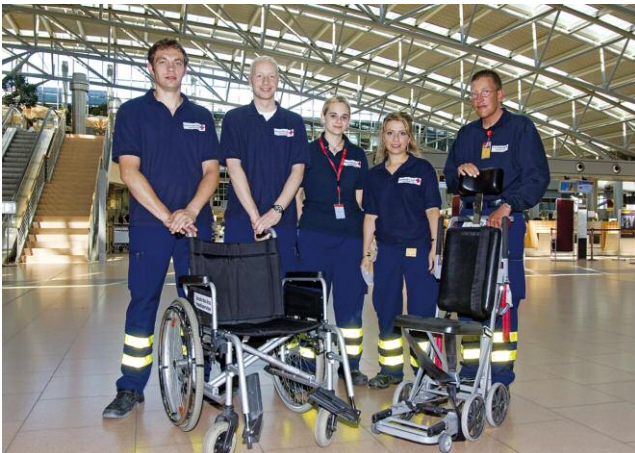
Für Sie zur Stelle: Das DRK mediservice-Team am Hamburg Airport

Der DRK mediservice am Hamburg Airport bietet Menschen mit eingeschränkter Mobilität zahlreiche Hilfeleistungen an. Um Ihnen die benötigte Hilfe zeitnah zur Verfügung stellen zu können, ist es wichtig, dass Sie diese möglichst schon bei der Buchung oder spätestens am Check-in-Schalter Ihrer Airline anfordern. Haben Sie Ihre Airline schon bei Ihrer Buchung informiert, verkürzt das die Wartezeit auf einen Mitarbeiter des DRK mediservice am Flughafen. Die Mitarbeiter des DRK mediservice halten Rollstühle, rollstuhlgerechte Fahrzeuge und einen klimatisierten Hublift bereit und sorgen dafür, dass Sie problemlos zu Ihrem Abflug-Gate und ins Flugzeug gelangen.