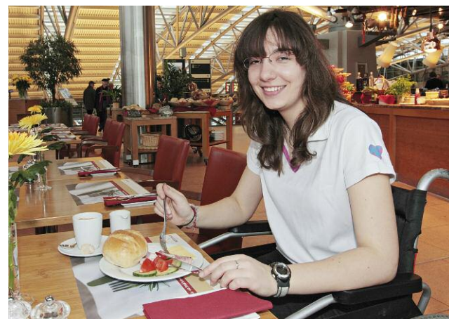
Die Airport Plaza bietet für jeden Geschmack etwas