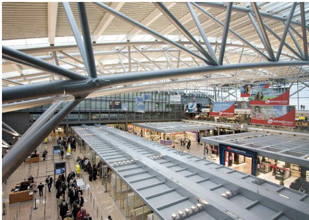
Großzügig und hell: die Airport Plaza

wir freuen uns, dass Sie Hamburg Airport als Ihren Abflughafen gewählt haben. Unsere Service-Mitarbeiter werden alles dafür tun, Ihre Reise so komfortabel und einfach wie möglich zu gestalten. Diese Broschüre gibt Ihnen einen Überblick über die Service-Einrichtungen für Menschen mit eingeschränkter Mobilität am Flughafen Hamburg.