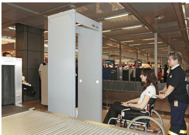
Zur schnelleren Abfertigung können Sie die Fast-Lane nutzen

Vom leckeren Cappuccino bis zum kompletten Menü – Hamburg Airport bietet Ihnen